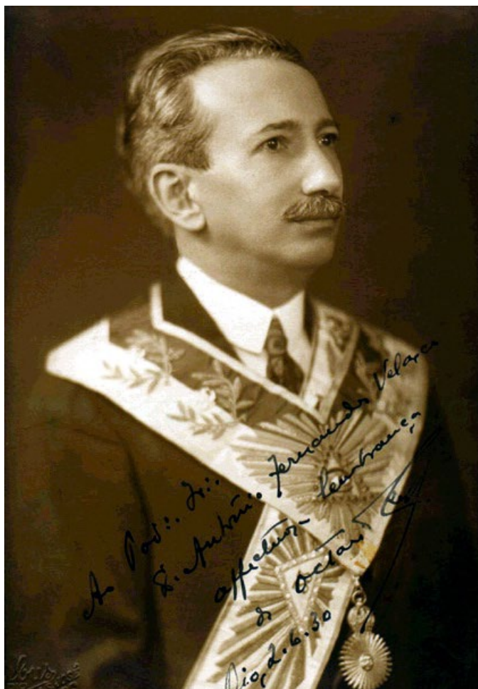
Gran maestro del Gran Oriente de Brasil (1928-1933)