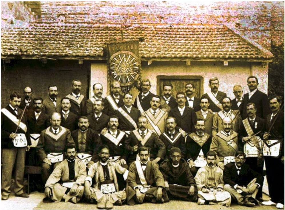
Miembros de la logia Abd-el-Aziz de Tánger (Marruecos)

Los imperialismos y los colonialismos fueron dos motores, junto con el comercio, del cosmopolitismo masónico. Logias de colonos que luego iniciaron a autóctonos, sin que la tradición masónica se pierda una vez que el territorio en cuestión se haya liberado administrativamente de la empresa colonial. El paternalismo y la cuestión de "patria" o "nación" fueron temas recurrentes en los talleres masónicos. Tánger fue una ciudad cosmopolita pues en varias ocasiones del siglo XX fue gobernada a la vez por varias alianzas o naciones extranjeras.