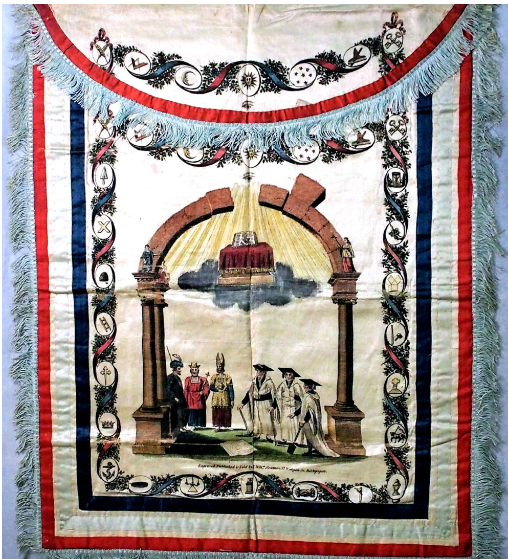
Mandil inglés confeccionado por William Newman (c.1795)

El mandil forma parte del “puzzle simbólico mínimo” de la masonería, el atuendo por excelencia del masón. Su ausencia impide el desarrollo de la práctica masónica. La diversidad de sus diseños, por ritos, grados, obediencias y lugares del mundo, le otorga una riqueza documental para el análisis de la historia material de esta organización y su propia época.